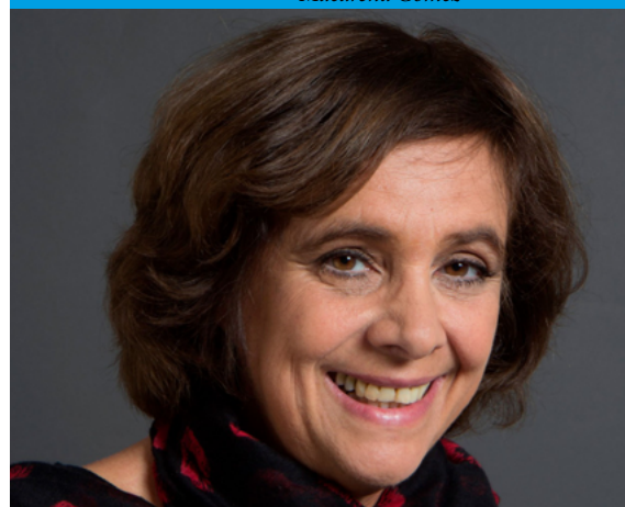
Ana María Shua