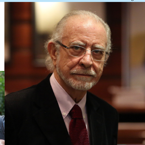
José María Merino