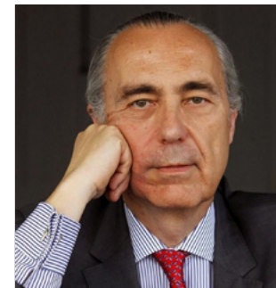
Luis Alberto de Cuenca