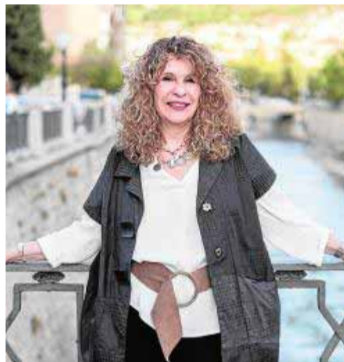
La escritora Gioconda Belli.