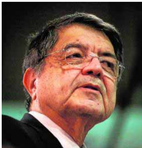
El nicaragüense Sergio Ramírez.