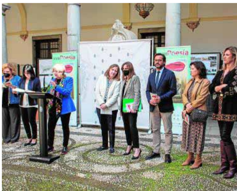
Un momento del acto de presentación.

Además de la autora bielorrusa, destaca la presencia del Premio Cervantes Sergio Ramírez y de Antonia Vicens, Premio Nacional de Poesía