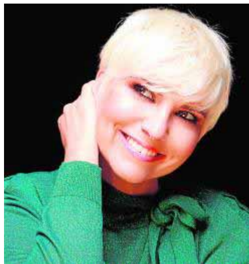
La cantante Pasión Vega.